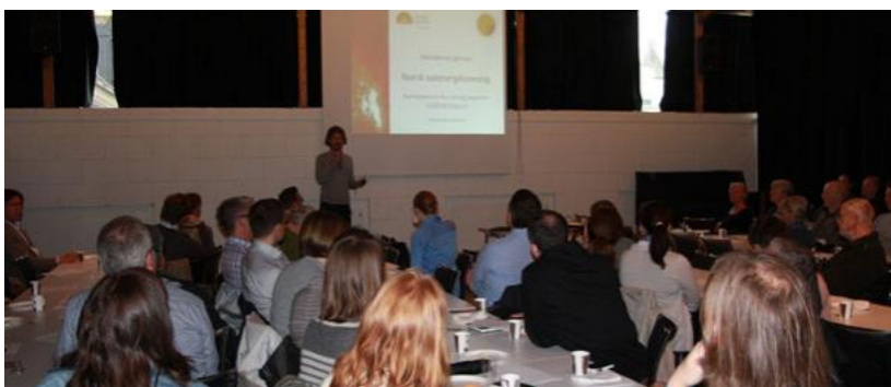
Et frokostmøtet i Arkitektenes Hus samlet onsdag et 80-talls arkitekter, samt flere representanter for norske leverandører sol solstrøm- og solvarmeanlegg