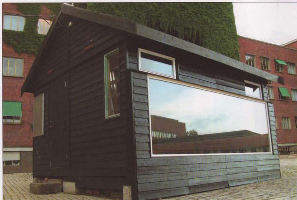
TEST. Nordans nye "vindu" med integrerte solfangere for oppvarming av varmtvann har blant annet vært testet ut i en paviljong utenfor Fysisk institutt ved Universitetet i Oslo.

Aventa benytter seg ikke av rør i sin teknologi, men av fullt dekkende